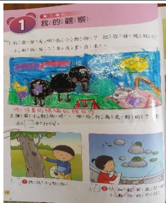
說明：完成生活習作上的任務