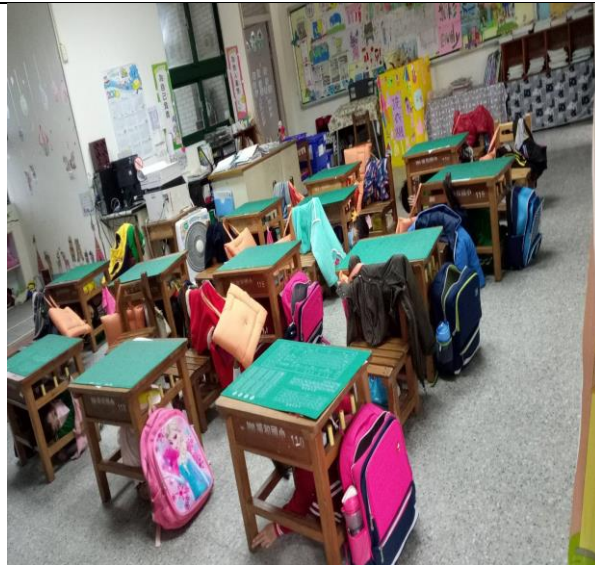
說明：防震災實地演練 3