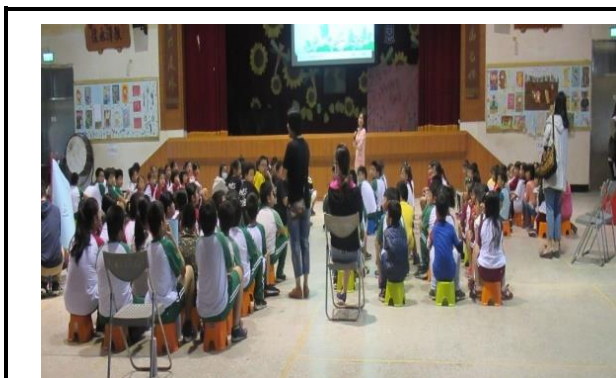
說明：每週主題宣導，環境教育