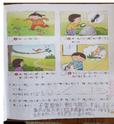
說明：能寫出如何保護動物