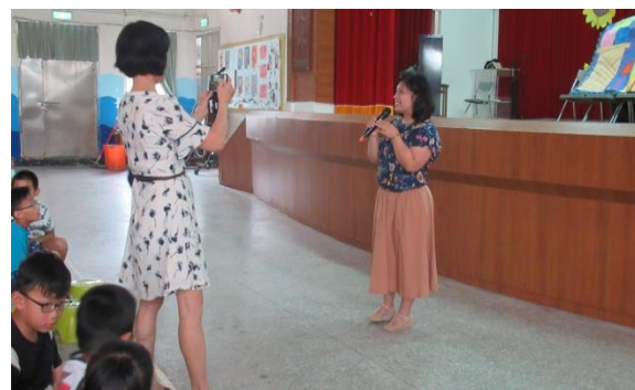
說明：孩子們認真學習