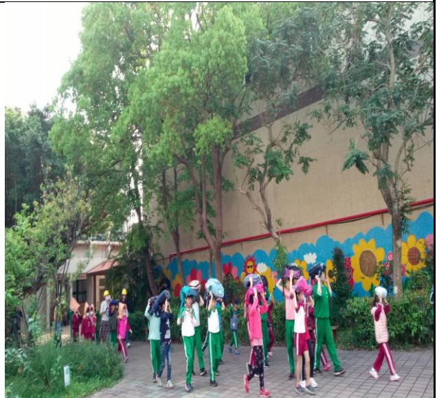
說明：：防震災實地演練 4