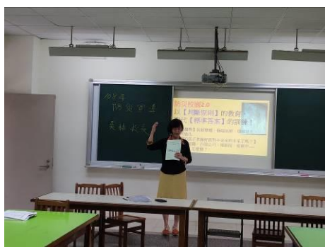
說明：校長對全校同仁進行環境教育宣講