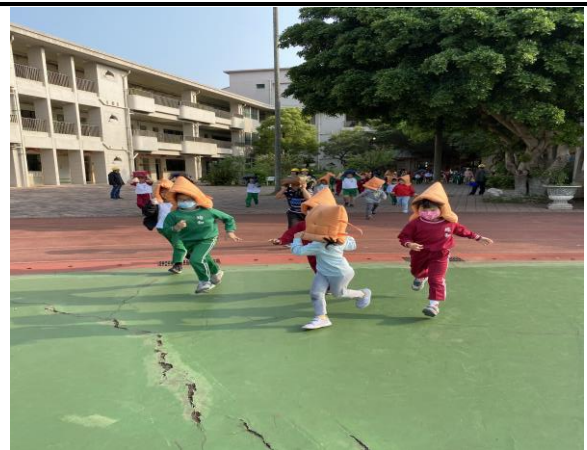
說明：：防震災實地演練 1