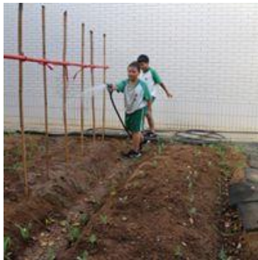
說明：體驗種植的學習