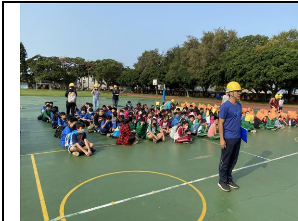
說明：防震災實地演練 1