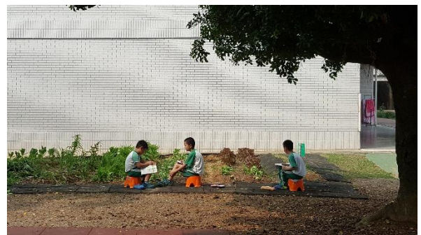
說明：就近認識植物生長