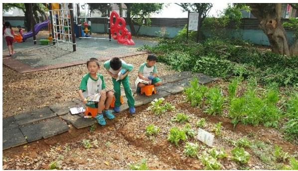
說明：在菜園觀察生物