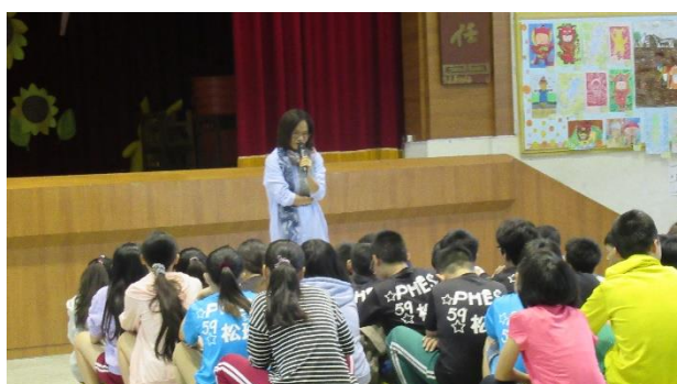
說明：主題教育-海洋教育宣導