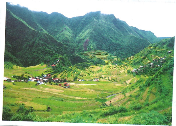
▶ 酷似古羅馬圓形環繞劇場的梯田

走進村中，村民看見我這個陌生人也紛紛和我打招呼，還拿出家中釀的米酒與我分享，邀請我到高腳屋裡頭參觀。高腳屋下層架高可以避開溼氣與毒蛇野獸的侵襲，也順便養些禽畜。爬木梯進入屋內便是起居空間，空間不大，上層用作儲藏室。屋前的空地，曝曬著收割後的稻米，每個空間都做了最好的利用。