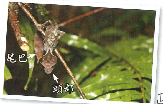
▲撒旦葉尾守宮的頭部與尾巴

1 連續兩天以來，開車所見景色都是平坦 2 的草地。「這裡不是有很多生物嗎？如果森 3 林都消失了，那麼生物去哪兒了？」我不斷 4 自問。到了傍晚，眼前開始出現茂密的森 5 林，嚮導告訴我們，已經來到拉努瑪法納國 6 家公園的緩衝區了。隔天我們起了個大早，天還沒亮就出發前 7 往國家公園。抵達公園後，嚮導突然指著前方說：「瞧，樹枝 8 上有隻守宮。」這時，我猛然想起牠就是瀕危物種「撒旦葉尾 9 守宮」，牠有著如枯葉般的扁平大尾巴，眼睛上面又長了一對 10 小角，會偽裝成枯葉或樹皮，使身體輪廓不著痕跡的和枯葉合