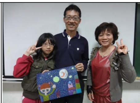
照過來—我們的創作