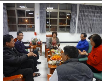
在校長室暢談教育理念