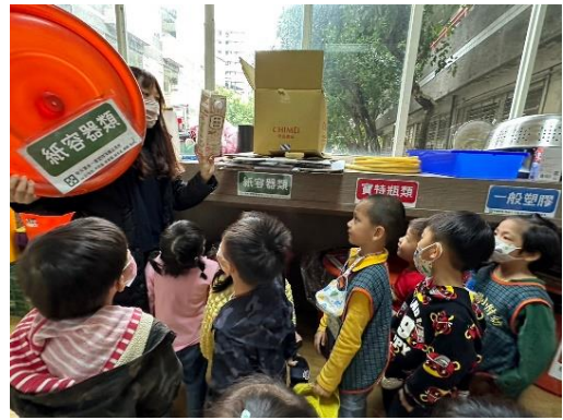
*說明：用母語介紹回收種類