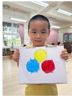
*說明：晨間任務用母語說出顏色