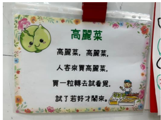
*說明：母語兒歌歌詞展示