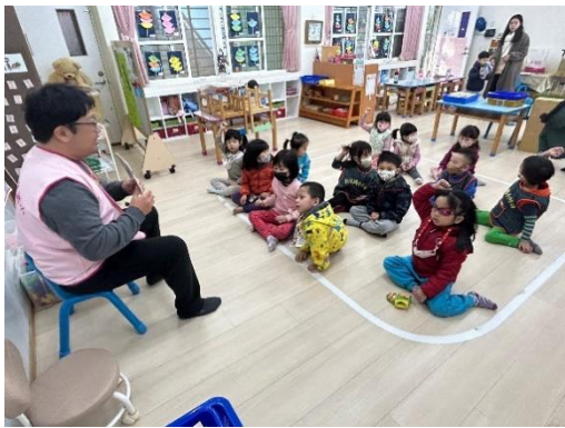
*說明：家長入班用母語說故事