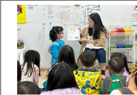
*說明：分享學習單後，用母語說「謝謝大家」