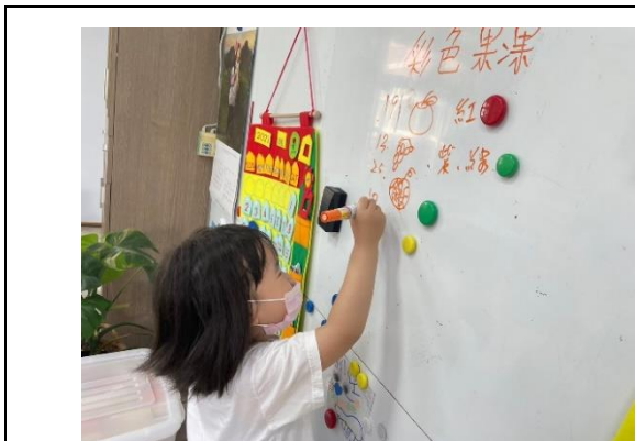
*說明：老師介紹水果的台語