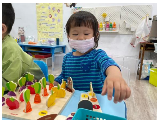
*說明：在教室張貼海報並提供水果教具