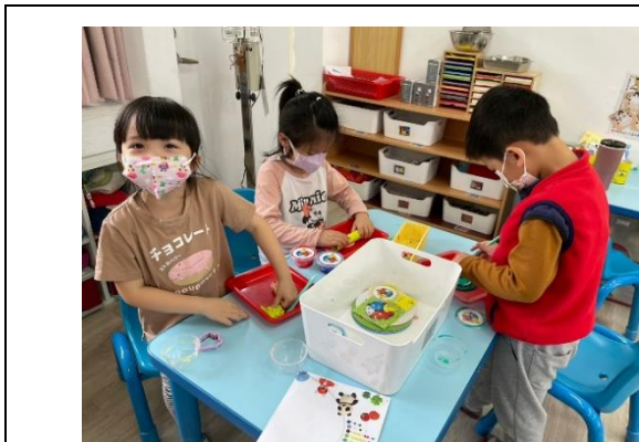
*說明：學習區做水果