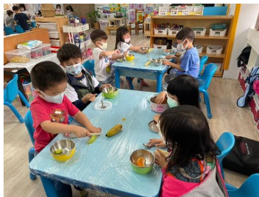
*說明：請幼兒製作水果果凍