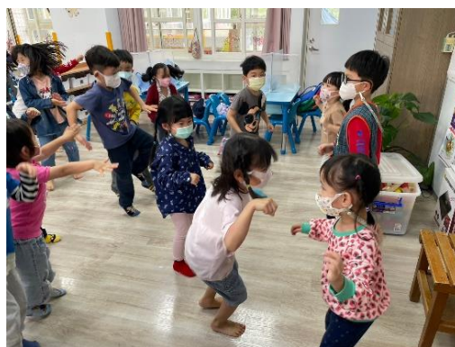
*說明：老師引導幼兒跳律動(高麗菜)