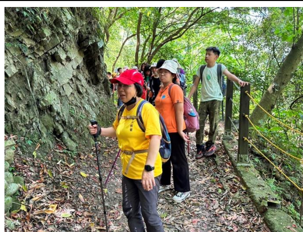
馬胎古道生態導覽