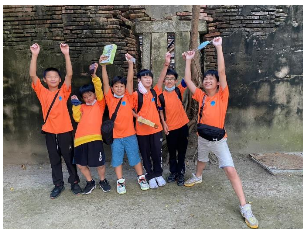
參訪台南古蹟(安平書屋)