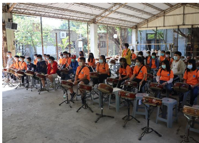
十鼓園區學習打鼓