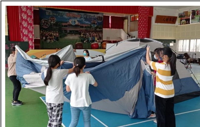
示範並練習搭帳篷囉！