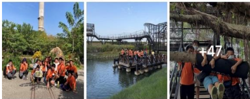
昶澤校長臉書分享(12月1日)