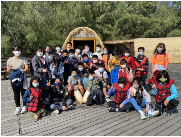
七股瀉湖生態之旅