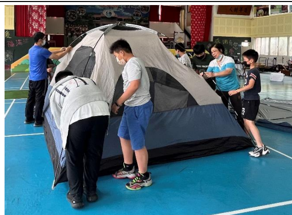
示範並練習搭帳篷囉！