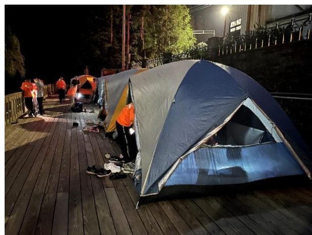
搭好晚上就寢的帳篷，成就感十足