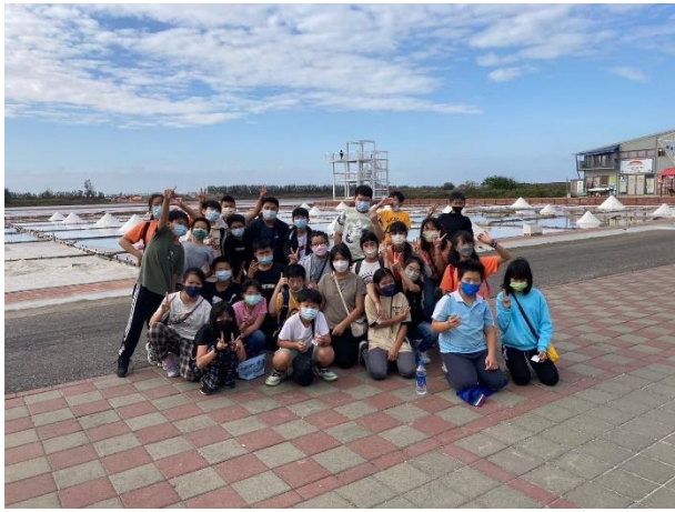
參觀井仔腳瓦盤鹽田