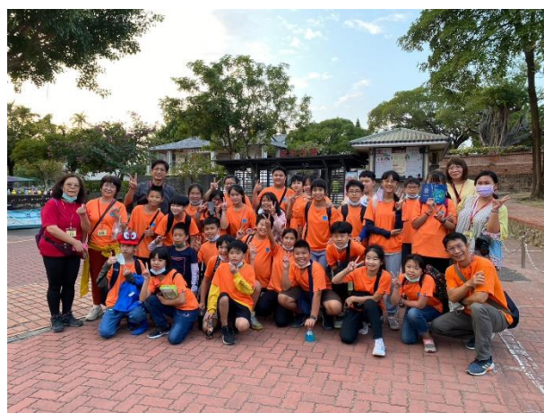
參訪台南古蹟(安平古堡)