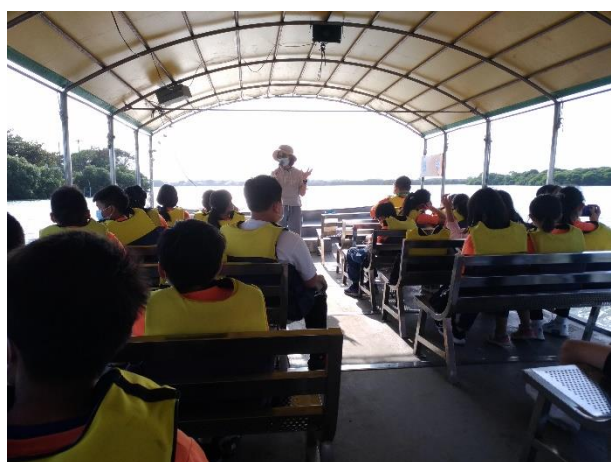
生態之旅導覽解說