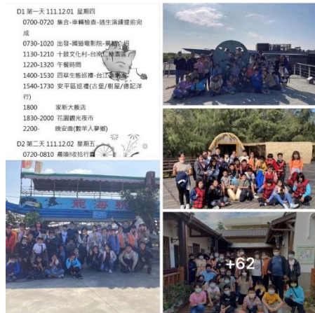
昶澤校長臉書分享(12月2日)