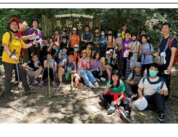
鳥語花香自然行活動成功！