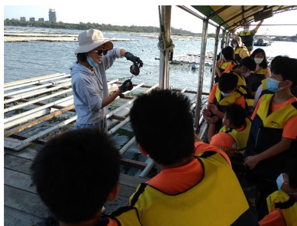
生態之旅導覽解說