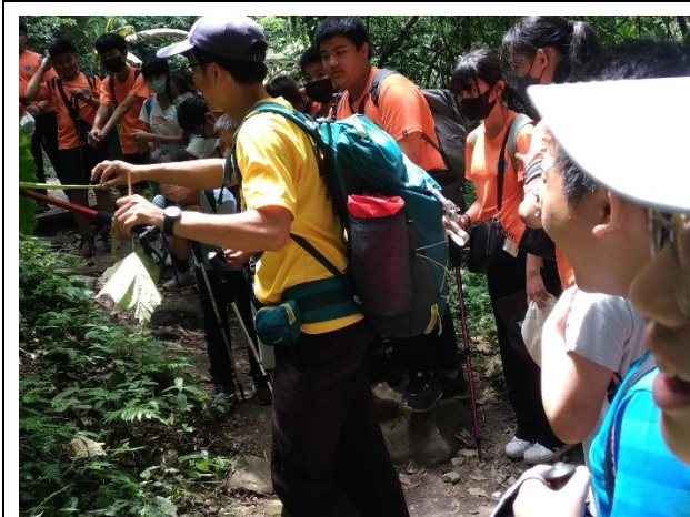
馬胎古道生態導覽