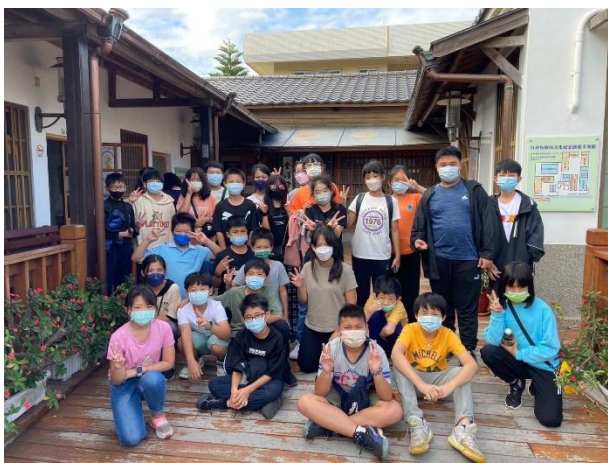
參觀烏腳病防治所