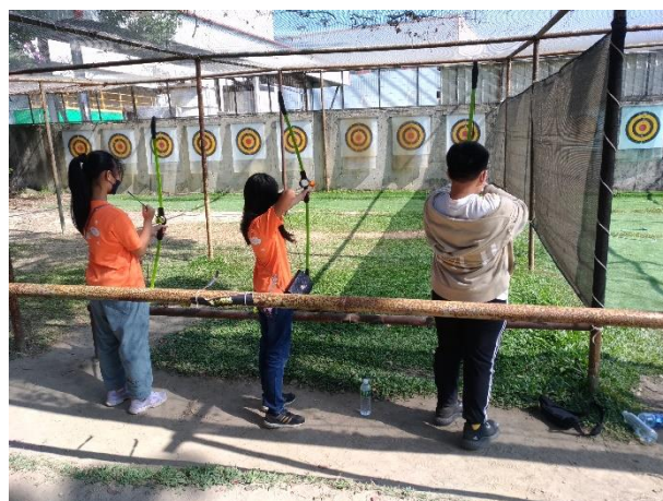
十鼓園區射箭體驗