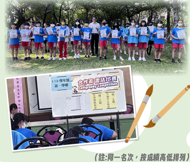
(註:同一名次,按成績高低排列)