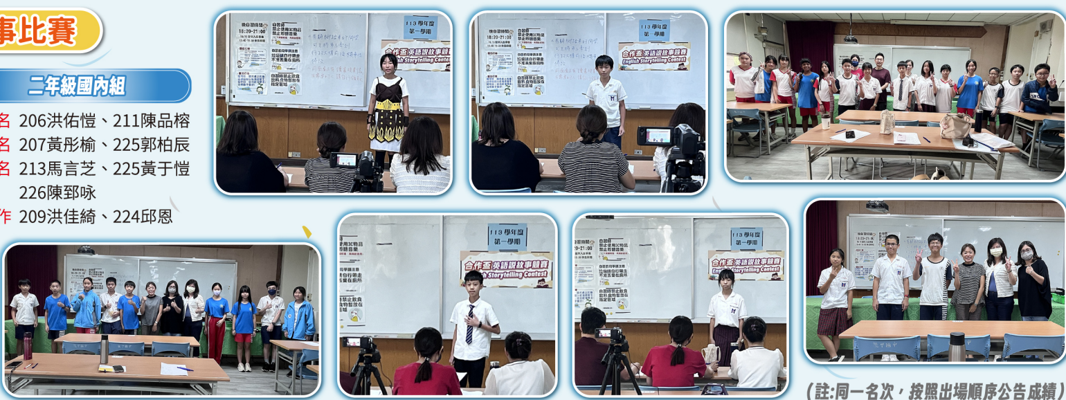
(註:同一名次,按照出場順序公告成績)