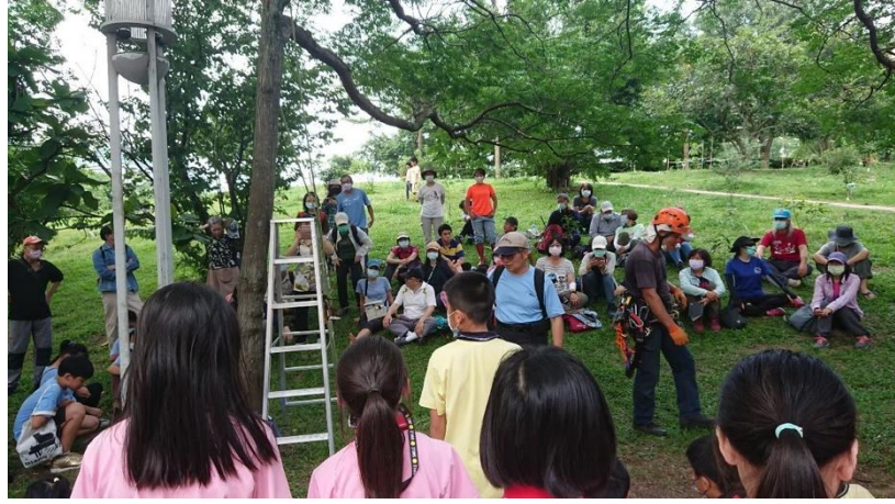
說明：與「韌性都市林」初次邂逅