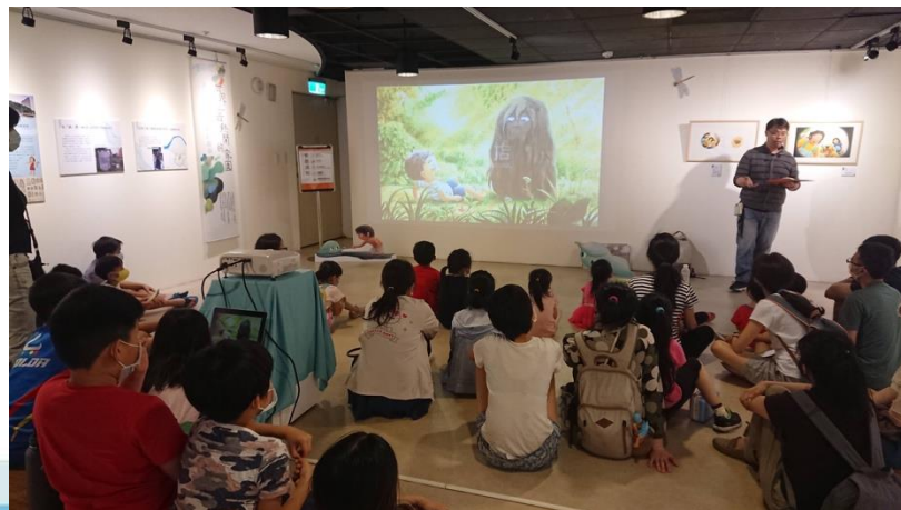
說明：一起聽『醜泥怪』的故事