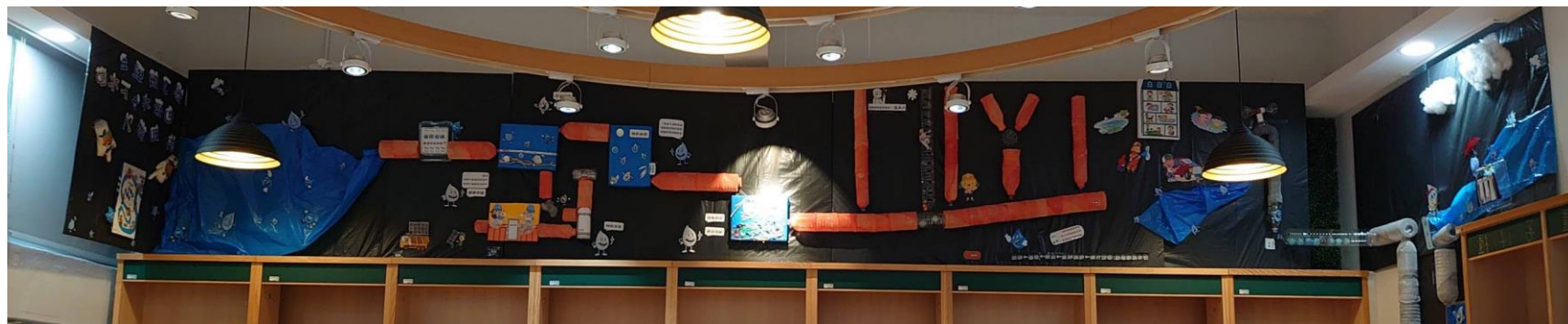
說明：將『小水滴環遊世界』繪本場景重現於圖書館中

建置優質閱讀環境，執行閱讀推動教師計畫，實施圖書館利用、閱讀素養、資訊素養課程、晨讀、共讀、家庭閱讀計畫等。