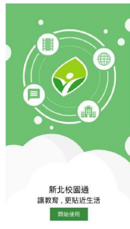
圖 1 APP 歡迎頁