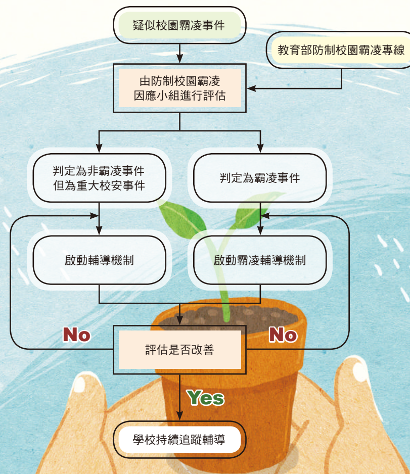
圖1 學校處理校園霸凌事件常見的步驟