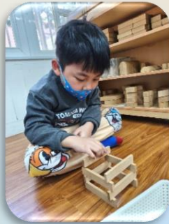
基本技法-往上疊放