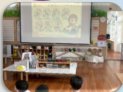
洗手步驟影片分享

透過PPT影片分享，讓幼兒了解病毒無所不在，病毒可經口、飛沫、接觸等多種途徑傳染，教導幼兒洗手五步驟「濕、搓、沖、捧、擦」及洗手七字口訣「內、外、夾、弓、大、立、腕」正確洗手；維持良好的衛生習慣，當位健康小小兵。