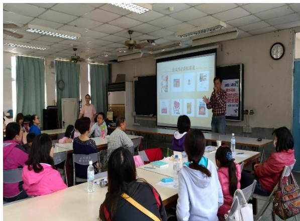
校長介紹講師，揭開精彩序幕