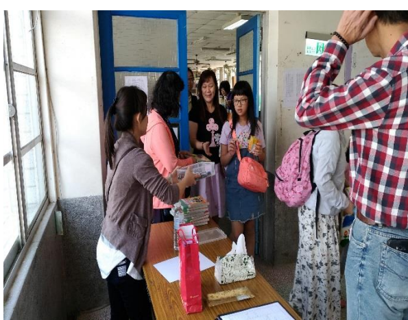
會後贈送家庭教育專書，家長開心賦歸