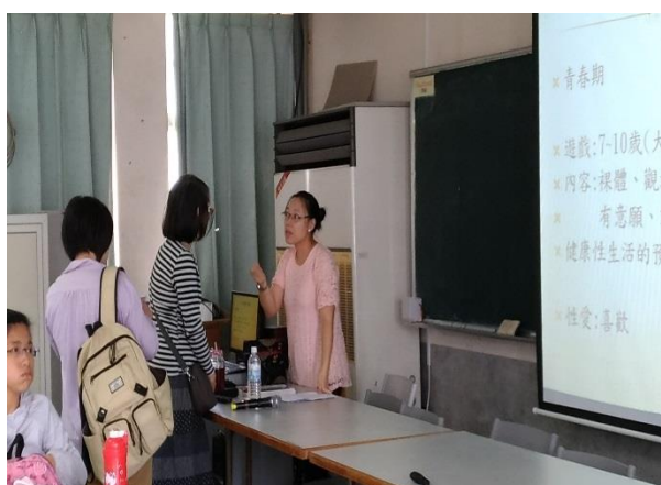
中場休息時間，家長與講師請益互動