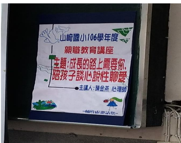
成長的路上需要你，陪孩子談心說性聊愛