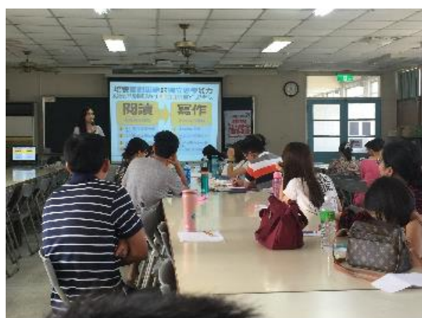
演講內容精闢獨到家長用心聆聽