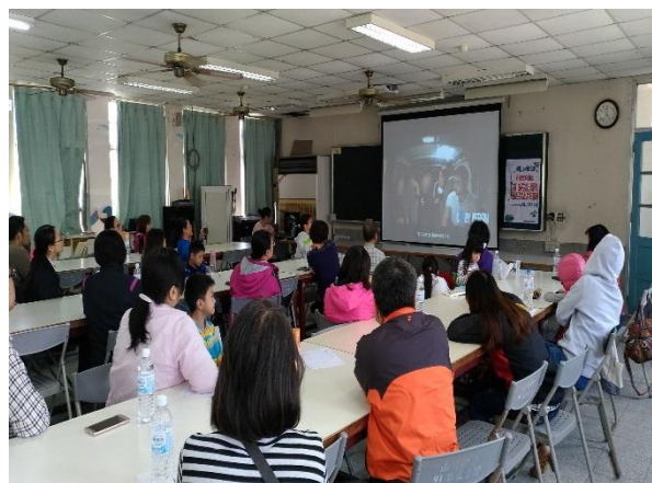
相關影片分享，如何引導孩子認識自己身體