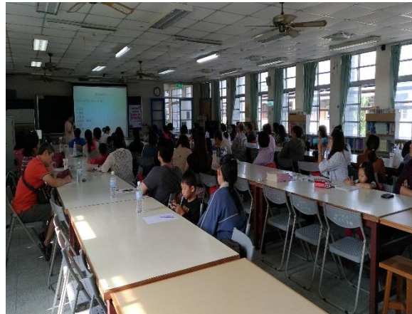
講演內容精采生動，家長用心聆聽