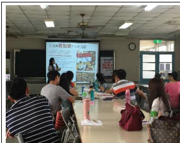
講師介紹全球的閱讀趨勢