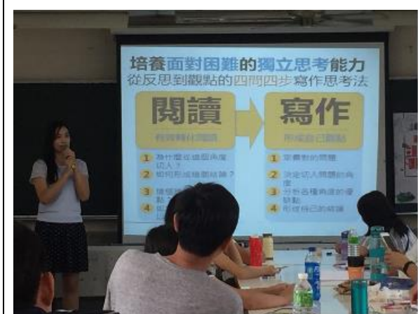
閱讀可培養獨立思考面對困難的能力